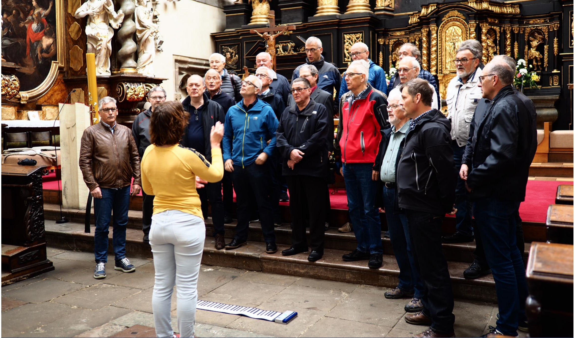
Ein Ständchen für den Pater