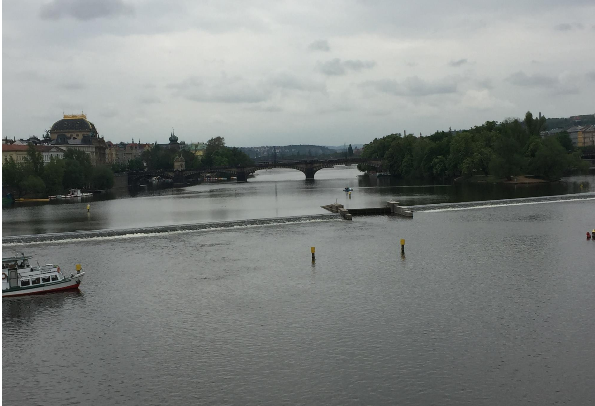
Die Moldau, oder auch das «Böhmische Meer»